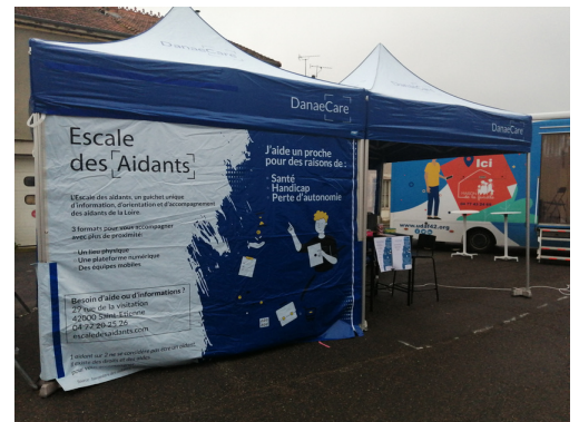
Saint-Martin-La-Sauveté, 16/05/2023 En partenariat avec l'UDAF

Retrouvez ci-contre les prochains déplacements