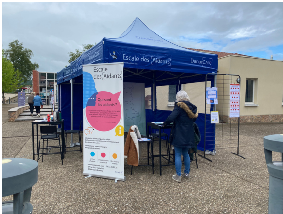
Saint-Romain-Le-Puy, 11/05/2023 En partenariat avec l'UDAF

N'hésitez pas à nous contacter à antenne@escaledesaidants.com ou au 04 77 20 25 26 (tapez 1, puis tapez 3) pour nous rejoindre lors d'un déplacement ou faire appel à nous pour nous déplacer dans votre commune.